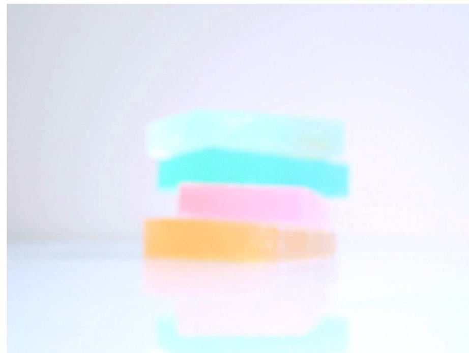
"Vies sereines 4" (120x80 cm)

** J'en ai rendu compte dans plusieurs numéros de la revue, à l'époque de sa version papier : "Les déambulations d'un vidéaste", Turbulences , n° 29, octobre 2000 ; "Les échoués de Frédéric Pollet", Turbulences , n° 30, janvier 2001 ; "Drôle de jeu et jeu de rôles, la fin d'une aventure à La Pommerie", Turbulences , n° 56, juillet 2007.